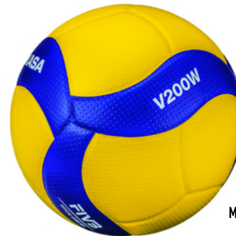
MATCHBOLL 875 KR/ST